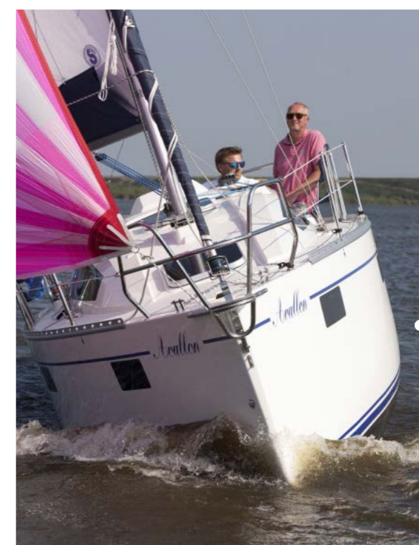
Moderne, strakke lijnen zowel in de romp als in de opbouw. De Balt oogt eigentijds en sportief.