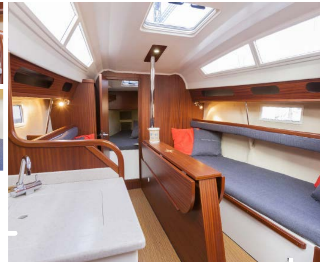
Ruim en erg goed gelukt. Het interieur van de Balt verdient een pluim.