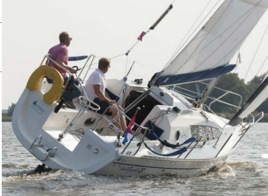
De kuip is prima. Je zit er comfortabel in en ook onder helling werkt hij goed