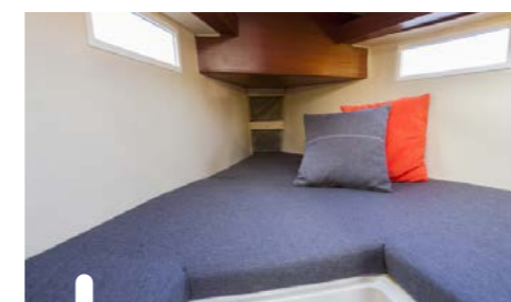
Het kombuis is compact en mist wat bergruimte. Het bed in de voorhut is groot genoeg voor twee volwassenen.